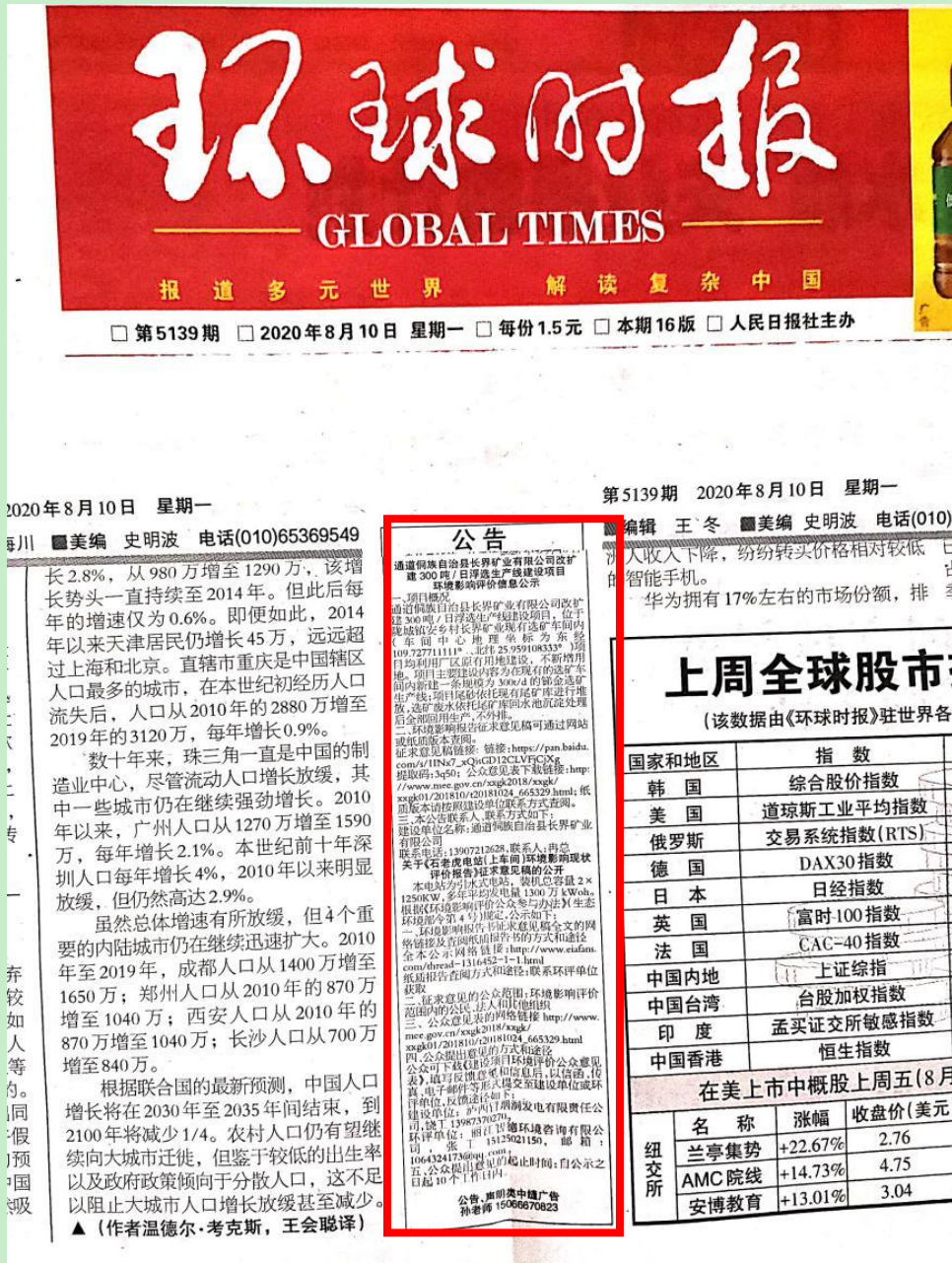
图 3.2-2 环球时报登报第一次公示

我公司“通道侗族自治县长界矿业改扩建 300 吨/日浮选生产线建设项目”环境影响报告书内容局部调整后，征求意见稿报纸公示 2020 年 8 月 12 日第二次报纸公示照片见下图。