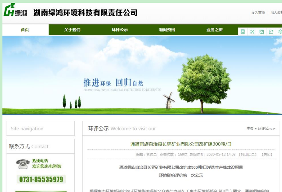
图 2.2-1 第一次项目基本情况网上公示截屏