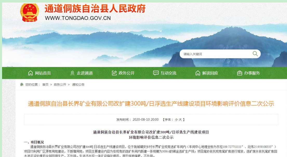
图3.2-1 通道县人民政府网站征求意见稿截屏

( http://www.tongdao.gov.cn/tongdao/c101153/202008/9d4ac42b61de4b0fbf8dacb57fdadbaa.shtml )，截图如下图 3.2-1；