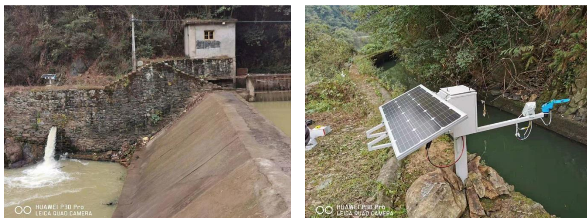
图 6-3 生态流量泄放设施及监控设施安装后 现状照片