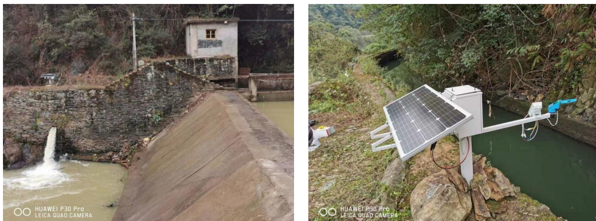
图 3-1 生态流量泄放设施及监控设施安装后 现状照片

电站目前采用的监测类型为动态视频，监测方式为在线监测，实时在线监视和测速、测流量。通过 Internet 将视频及机组运转情况数据上送至水务局监管平台，同时，将生态泄放流量数据通过网络上传到企业云，作为历史资料保存备查。目前生态流量泄流设施和监控设施已经建成并通过靖州县水利局等相关部门的验收。