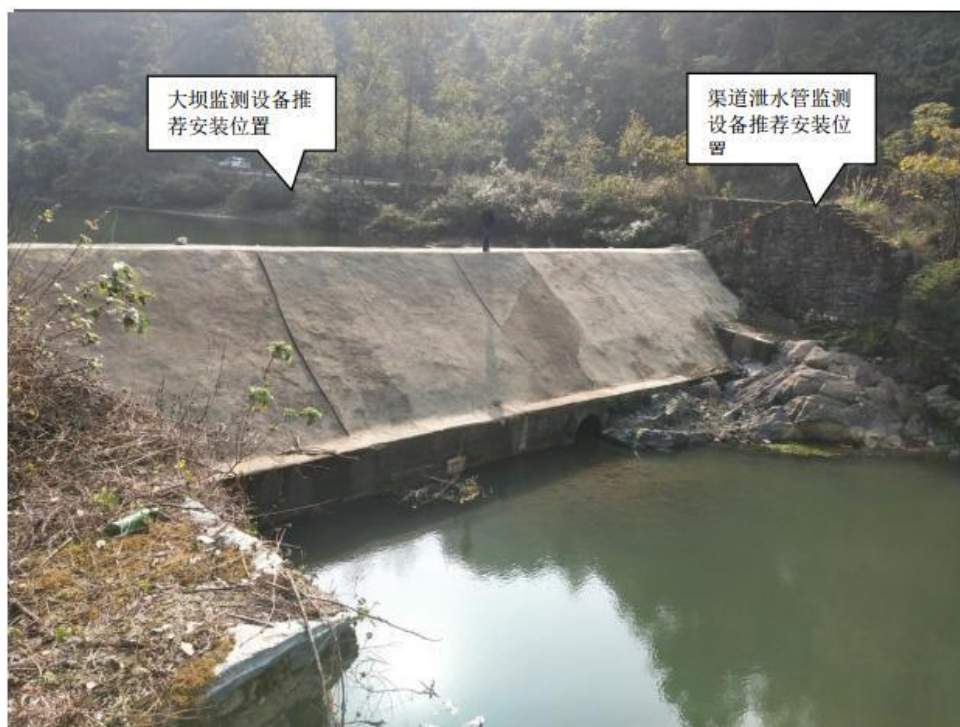
图 6-2 生态流量监控系统位置示意图