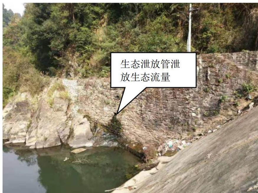
图 6-1 生态流量泄放管位置示意图

1孔 0.4\times 0.4\text{m} （宽 \times 高），位于正常蓄水位下2.3米，大坝正常蓄水位360.40米。发电时最低水位359.40米。泄水孔最低水深 H=1.3\text{m} ，为了保证引水渠头部生态泄水孔不断流，本次实施在原泄水孔埋设DN400mm放水钢管，引水通过原泄水孔，泄放生态流量，可满足最小下泄流量 0.53\text{m}^3/\text{s} 要求。