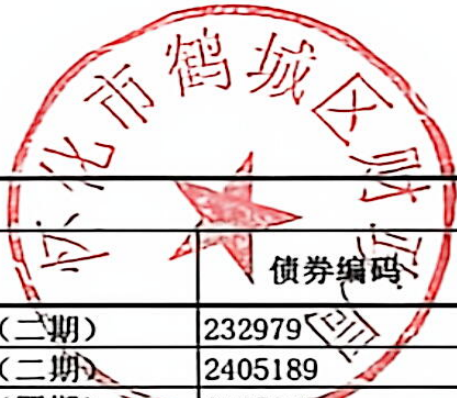
2024年--2025年末431202 鹤城区发行的新增地方政府一般债券情况表